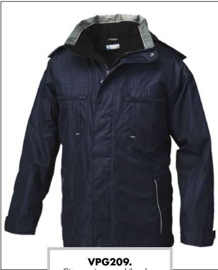
VPG209. Giaccone impermeabile colore blu, taglie dalla S alla XXXL