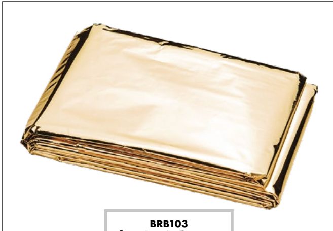
BRB103 Coperta isotermica d'emergenza, dimensioni 160 x 220 cm