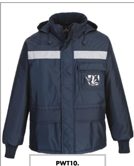
PWT10. Giacca 3/4 per cella frigo, taglie dalla S alla XXL