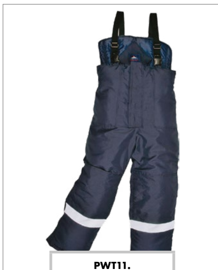
PWT11. Pantaloni salopette per cella frigo, taglie dalla S alla XXL