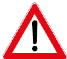
F.R. 190 035