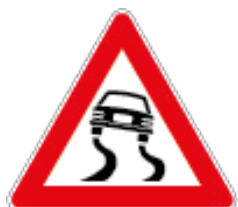
F.R. 190 022