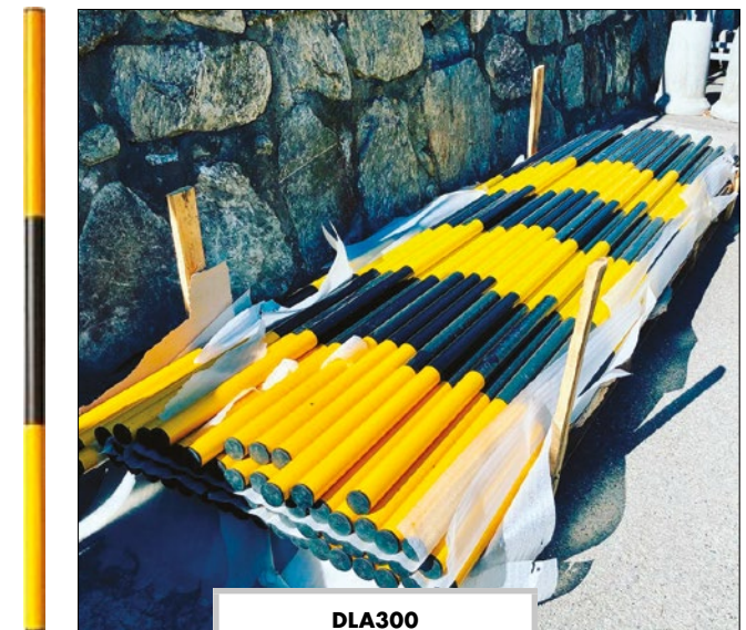
DLA300 Delineatore per strade di montagna a strisce giallo/nera