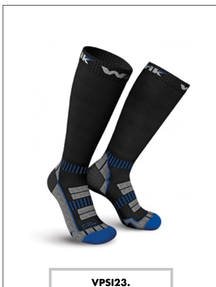
VPSI23. Confezione da 6 paia di calze invernali, taglie dalla S alla L