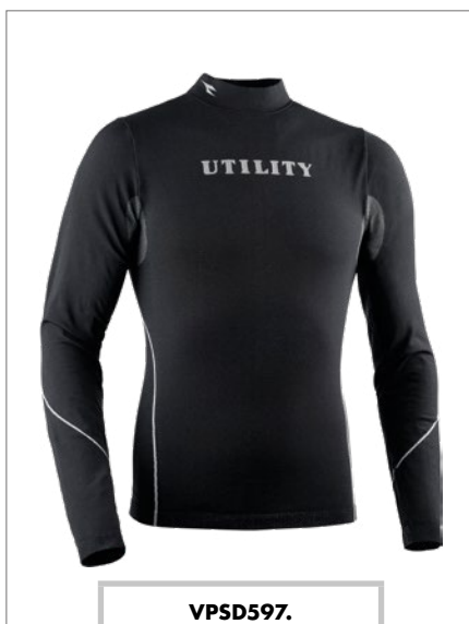
VPSD597. Maglia termica a maniche lunghe, taglie fornibili S/M - L/XL - XXL