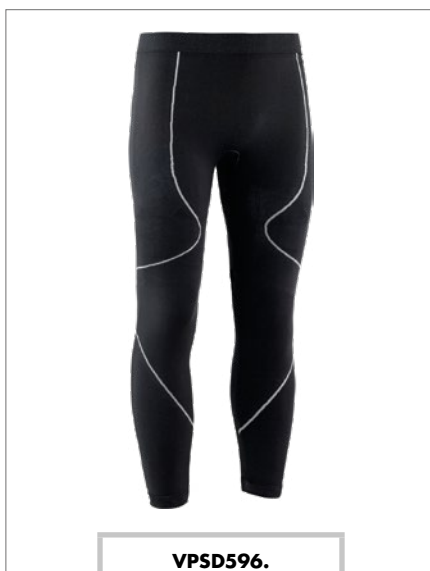
VPSD596. Pantalone termico unisex, taglie fornibili S/M - L/XL - XXL