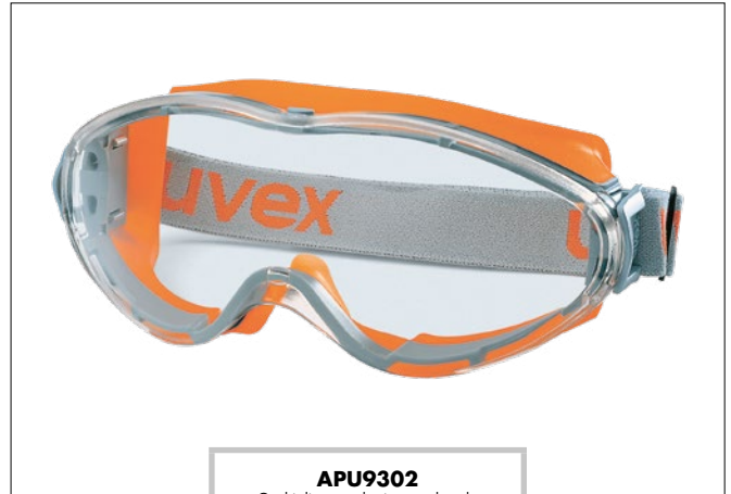
APU9302 Occhiali a mascherina con banda elastica sintetica regolabile