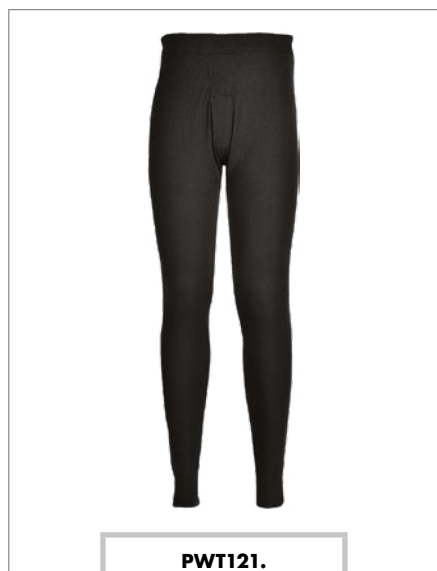
PWT121. Calzamaglia termica isolante, taglie dalla S alla XXL