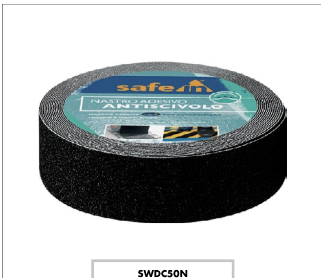
SWDC50N Nastro antiscivolo "Conformabile" lunghezza 18,3 mt, altezza 5 cm