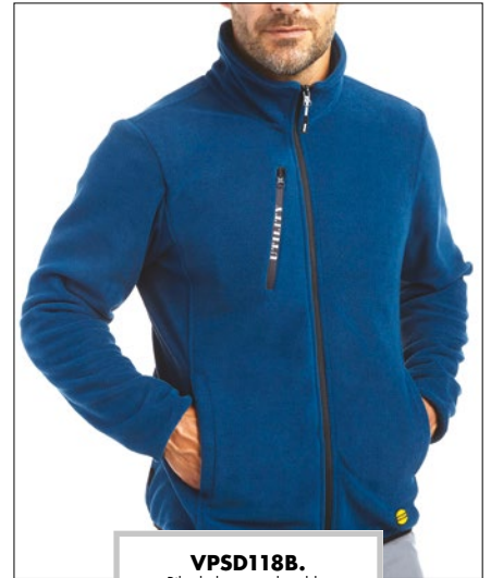
VPSD118B. Pile da lavoro colore blu, taglie dalla S alla XXXL