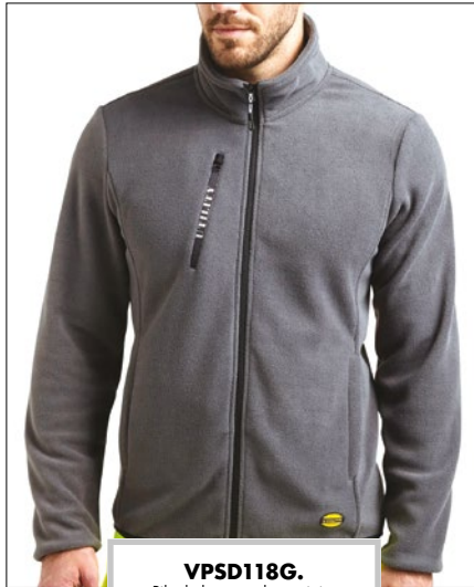
VPSD118G. Pile da lavoro colore grigio, taglie dalla S alla XXXL