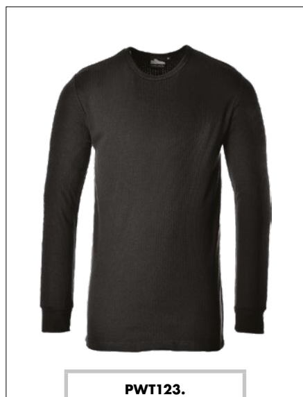
PWT123. Maglia termica a maniche lunghe, taglie dalla S alla XXL