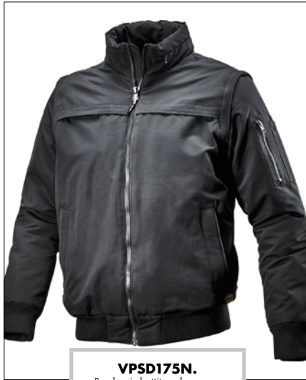
VPSD175N. Bomber imbottito colore nero, taglie dalla XS alla XXXL