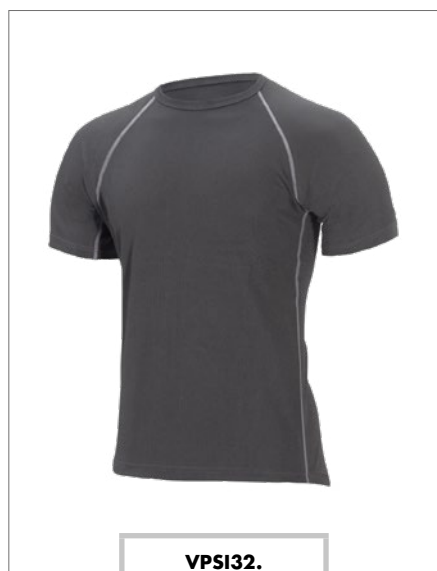
VPSI32. T-shirt termica, taglie dalla M alla XXXL