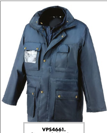
VPS4661. Giaccone antifreddo triplo uso, taglie dalla S alla XXL