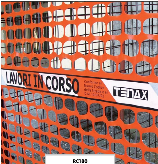
RC180 Rete da cantiere con banda "Lavori in corso", rotolo da 50 mt, altezza 1,80 mt