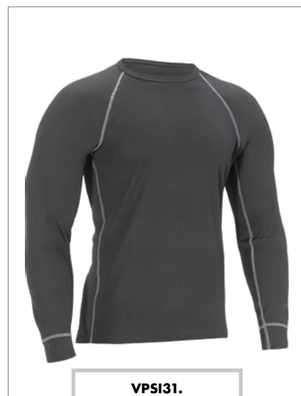
VPSI31. Maglia termica a maniche lunghe, taglie dalla M alla XXXL