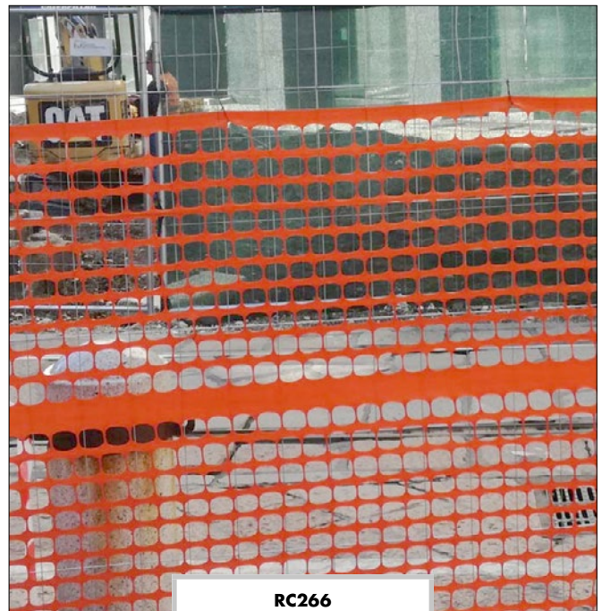
RC266 Rete da cantiere (3,3 kN/m), rotolo da 50 mt, altezza 1,20 mt