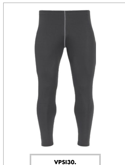
VPSI30. Sottotuta termico senza patta, taglie dalla M alla XXXL