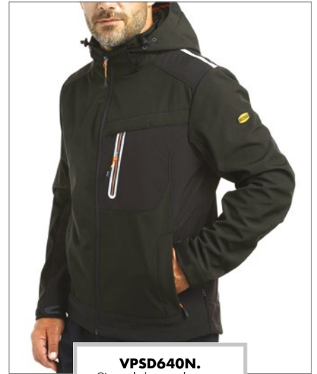
VPSD640N. Giacca da lavoro colore nero, taglie dalla S alla XXXL